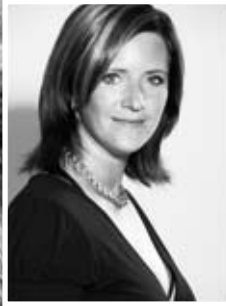
Wendy Management Ass.