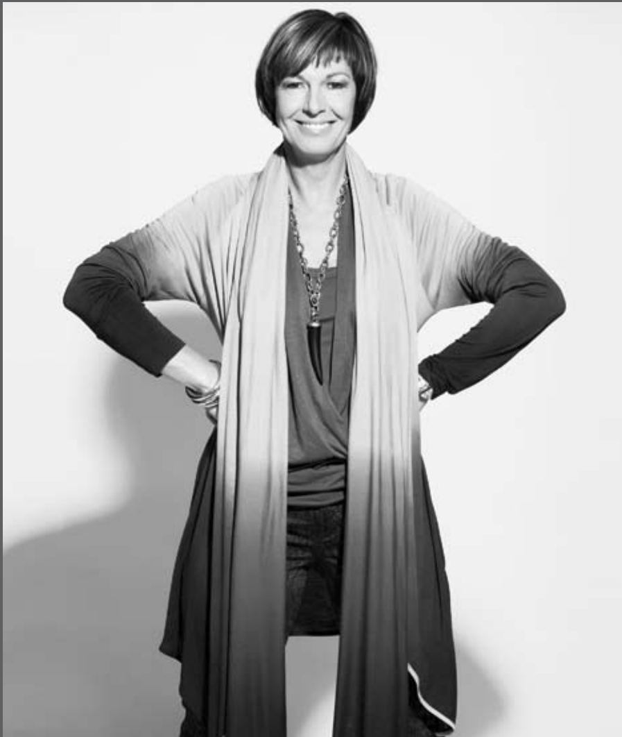
Broek van Cambio, top en vest van Stills