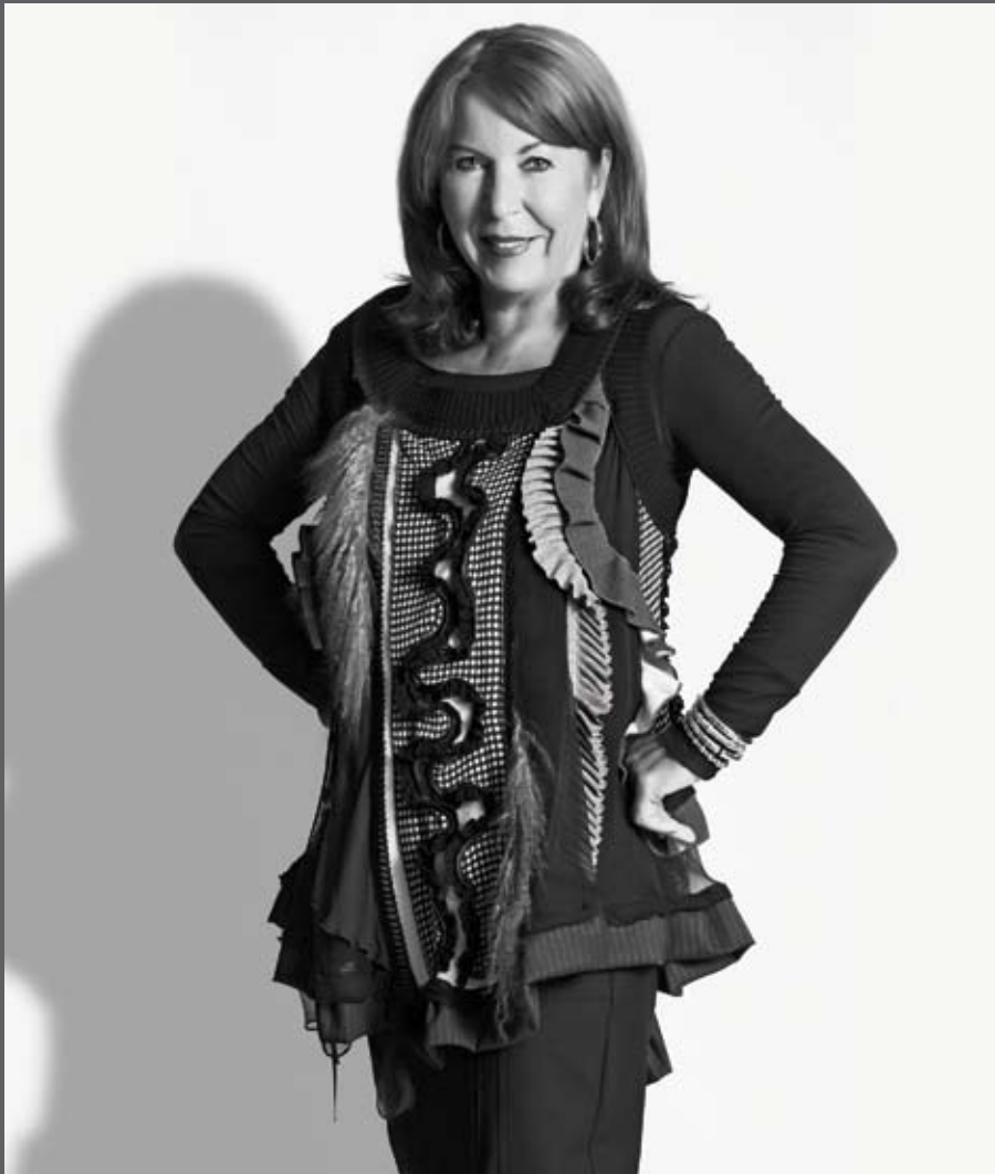
Trui en broek van Tricot Chic