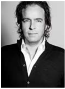
Gilbert Creative Director